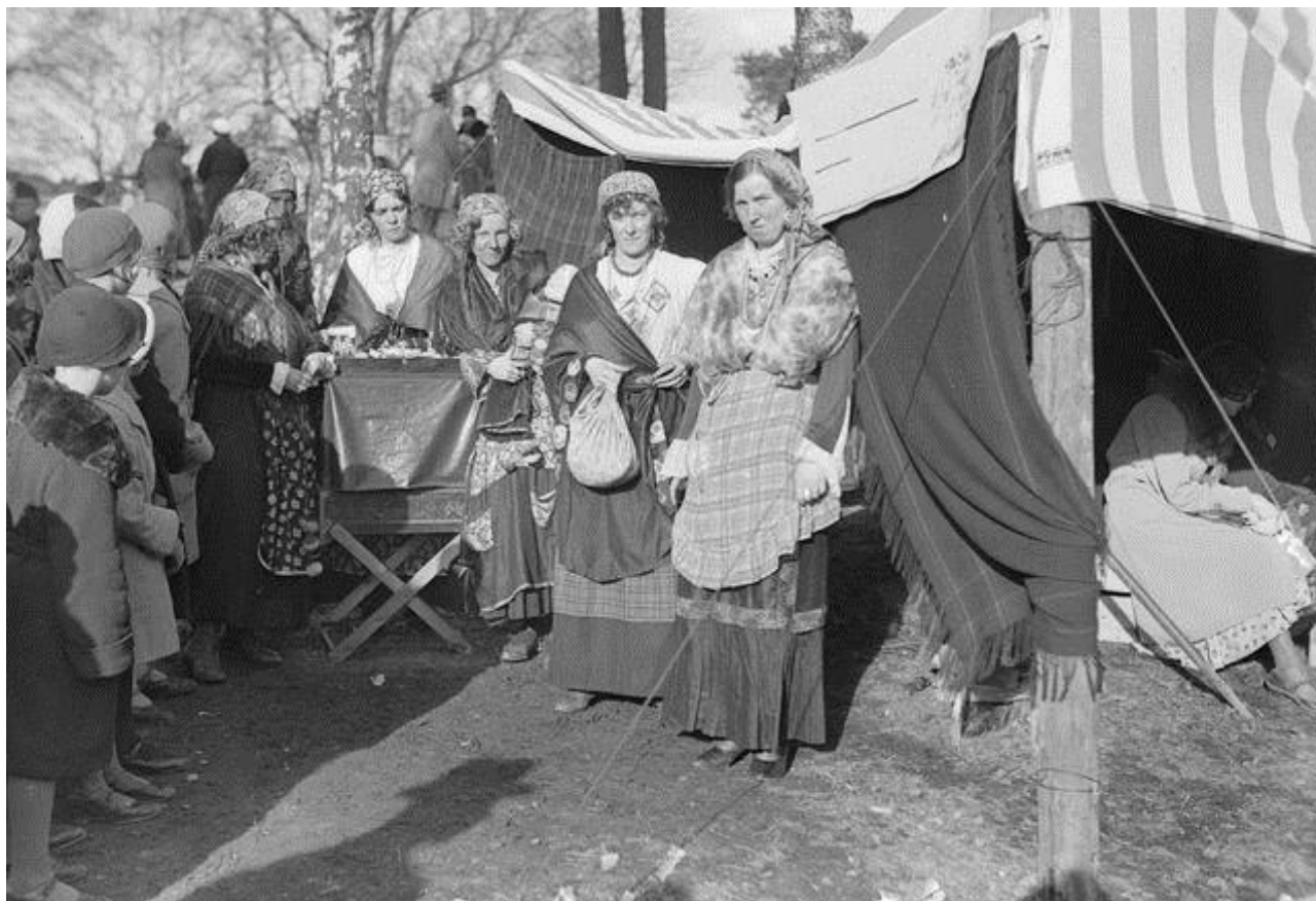
Lotat romaneina 1918 voitonparaatin kenttäjuhlassa.