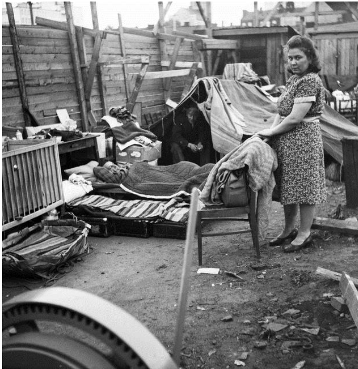
Asunnottomuutta Helsingissä 1950