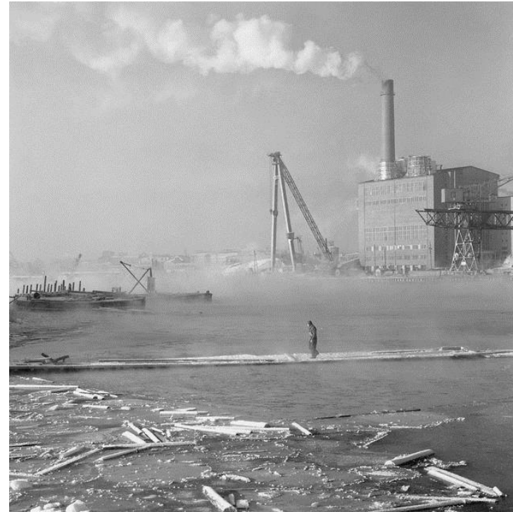
Hanasaaren hiilivoimala 1960-luvulla Teuvo Kanerva, Historian kuvakokoelma.