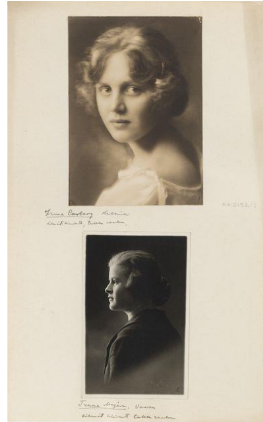
Suomalainen naistyyppi 1926. Kansatieteen kuvakokoelma.