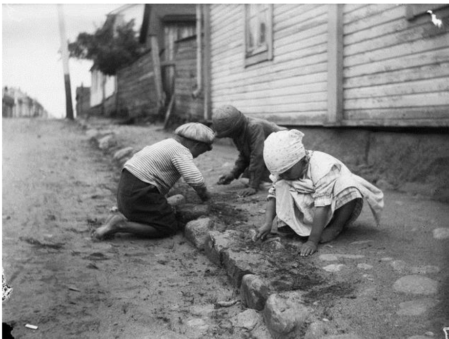
Lapset katua kraappaamassa Raahessa 1923