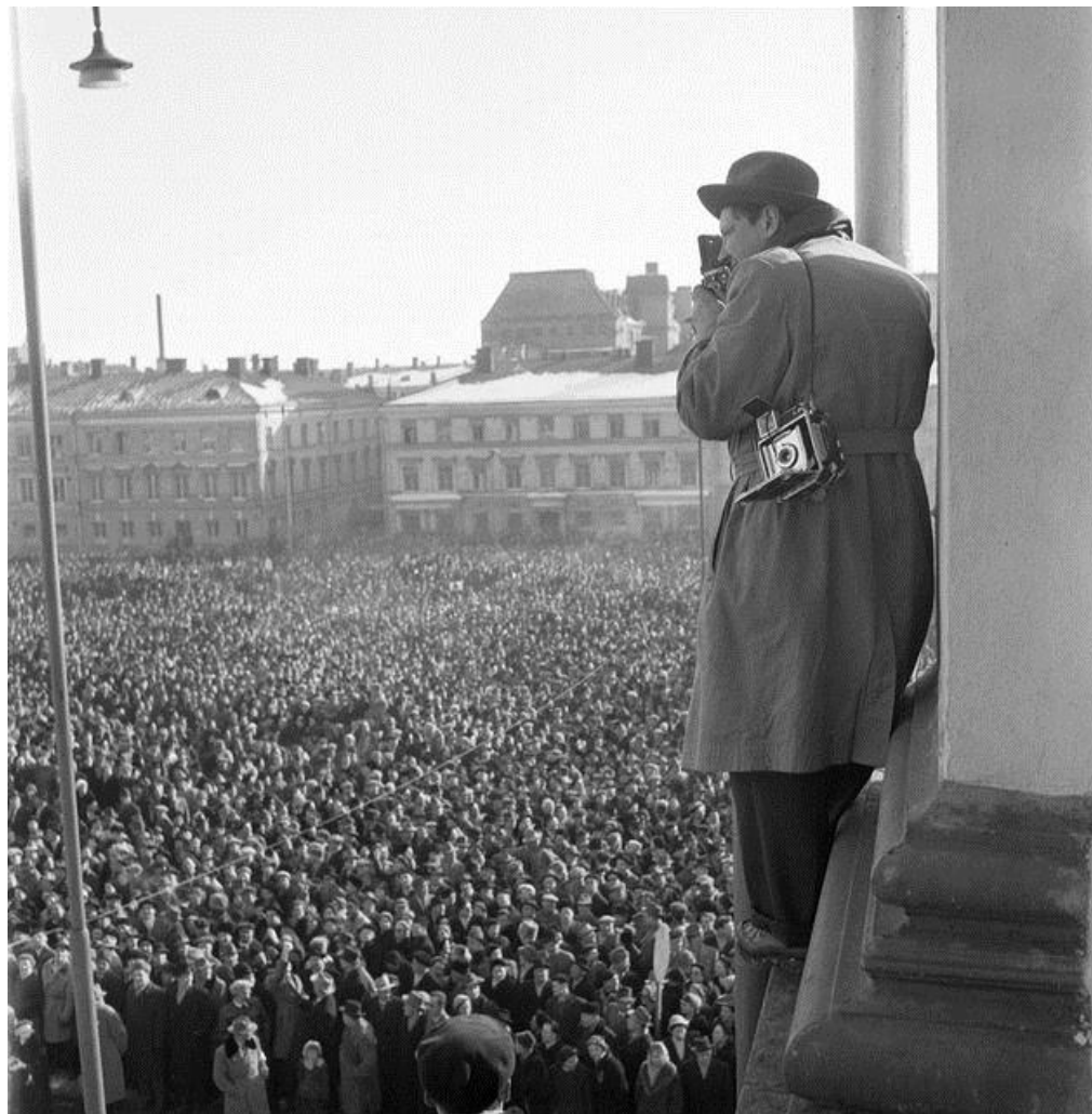
Suurlakko 1956.