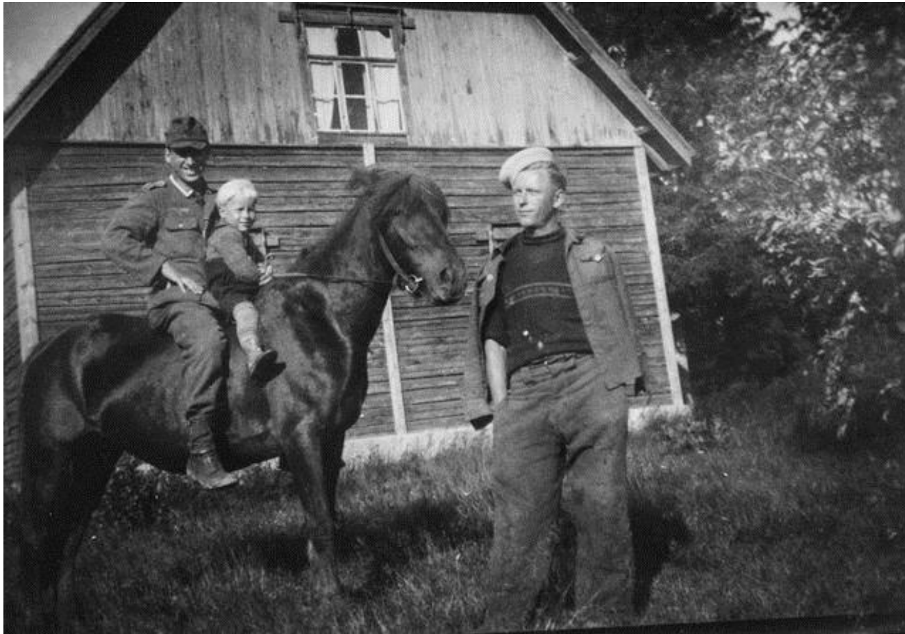
Saksalais-suomalais-neuvostoliittolaista rinnakkaiseloa 1944. Kansatieteen kuvakokoelma.