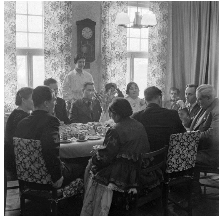
Hagertin sukua 1955