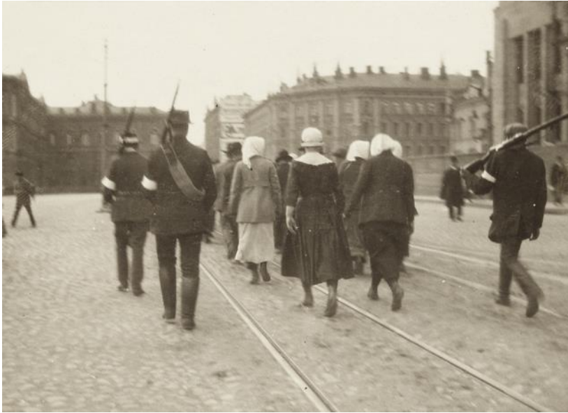
Punakaartilaisia naisia Helsingissä 1918. Historian kuvakokoelma.