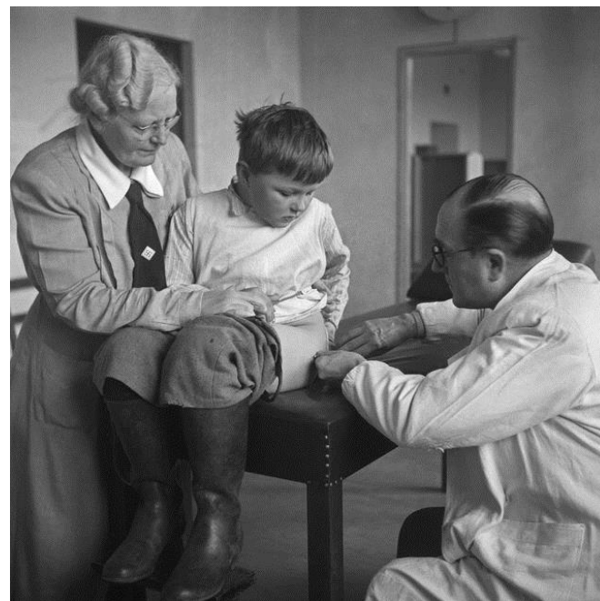
Aleksis Kiven koulussa Helsingissä 1949.